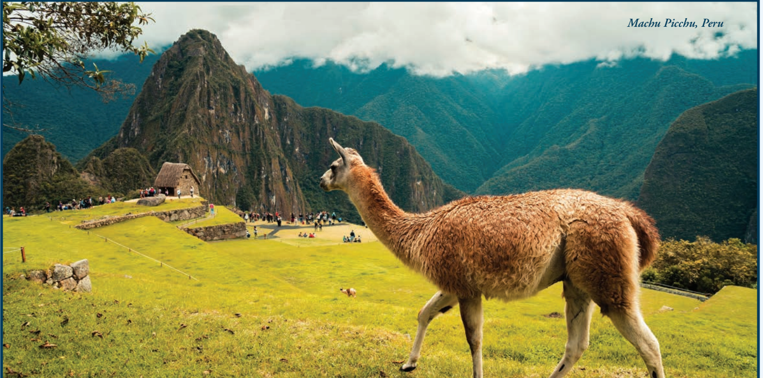
Machu Picchu, Peru