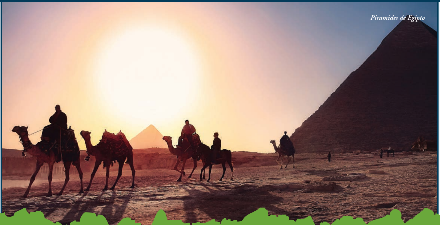
Piramides de Egipto

Visita nuestro BLOG, pagina de INSPIRACION y demás CONSEJOS. Inscribe tu EMAIL para recibir excelentes ofertas de viaje www.ToursEnEspañol.com